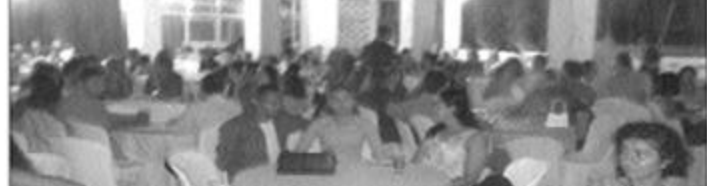
Servidores, familiares e convidados prestigiaram festa na América

A comemoração do Dia do Funcionário Público, em 28 de outubro, e a tradicional confraternização natalina, no final do exercício administrativo, são as principais atividades de lazer e lazer promovidas pela ASTRA-21.