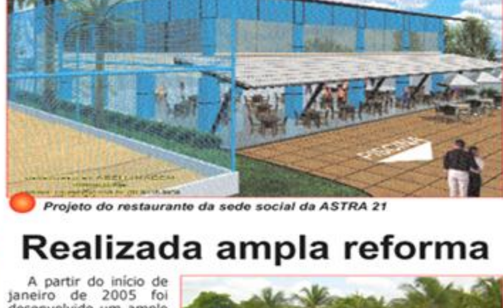
Projeto do restaurante da sede social da ASTRA 21

Apresentar o projeto arquitetônico para construção do restaurante, salão de jogos e academia da sede social da ASTRA 21 em Pium.